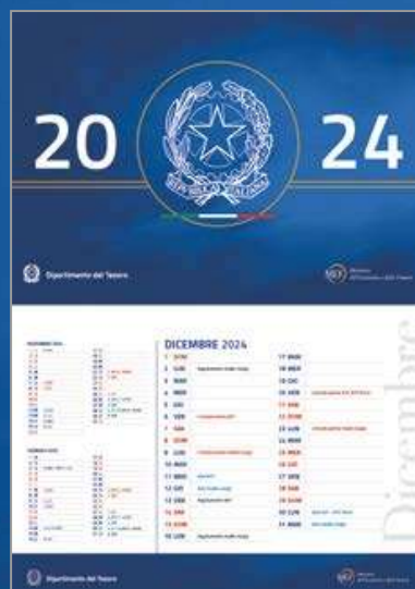
CALENDARIO DELLE ASTE DEI TITOLI DI STATO