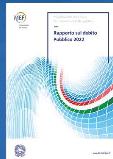
RAPPORTO SUL DEBITO PUBBLICO

Per informazioni ed aggiornamenti: www.dt.mef.gov.it/it/debito_publico