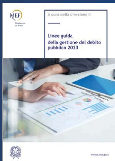
LINEE GUIDA DELLA GESTIONE DEL DEBITO PUBBLICO