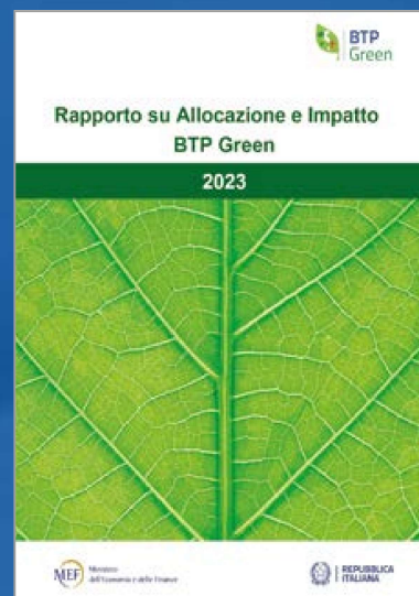
RAPPORTO SU ALLOCAZIONE E IMPATTO BTP GREEN